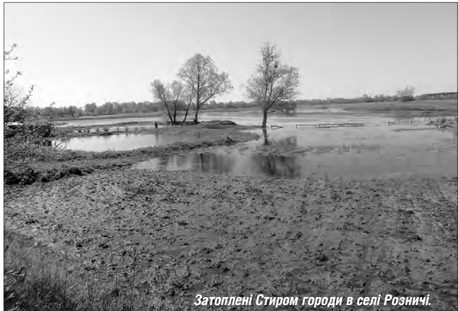
Затоплені Стиром городи в селі Розничі.